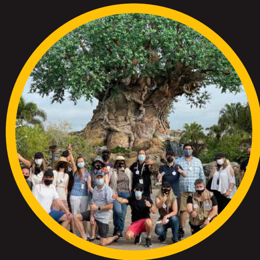
Edición 3 mar 2021 incompany EO LatAm