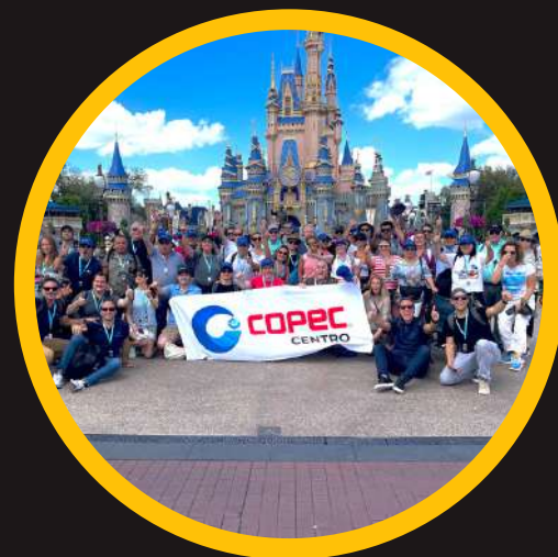
Edición 7 mar 2022 1ro COPEC