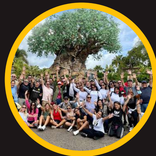
Edición 8 mar 2022