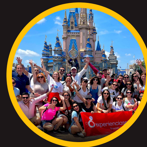
Edición 11 jun 2022