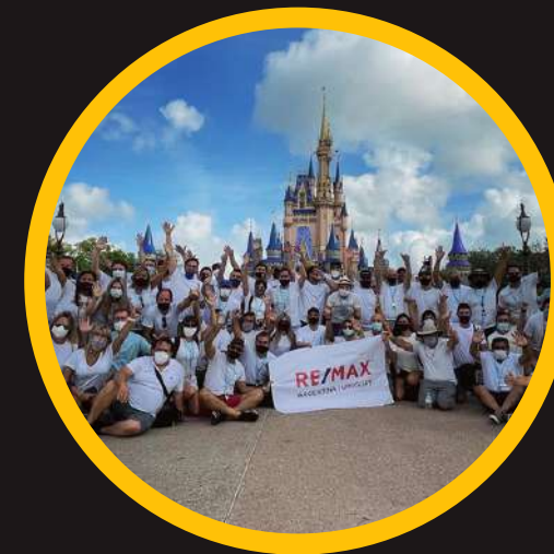
Edición 5 abr 2021 incompany RE/MAX