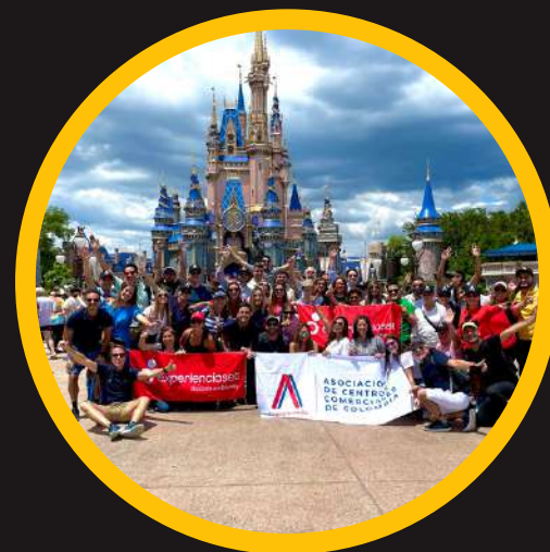
Edición 10 may 2022 incompany Acecolombia