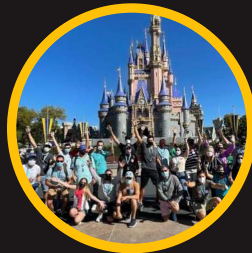
Edición 4 mar 2021