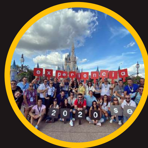
Edición 2 feb 2020