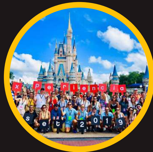
Edición 1 sep 2019

La empresa LatAm que mayor cantidad de ejecutivos llevó a estudiar