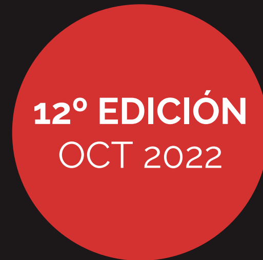
12º EDICIÓN OCT 2022