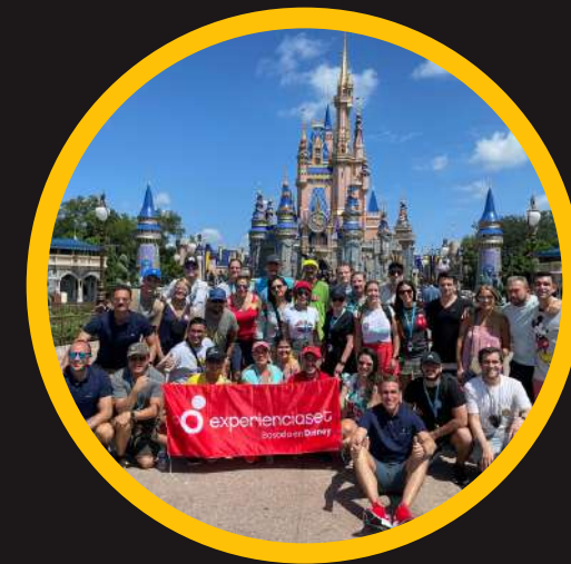
Edición 6 sept 2021