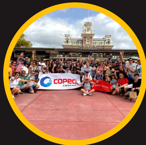
Edición 9 abr 2022 2do COPEC